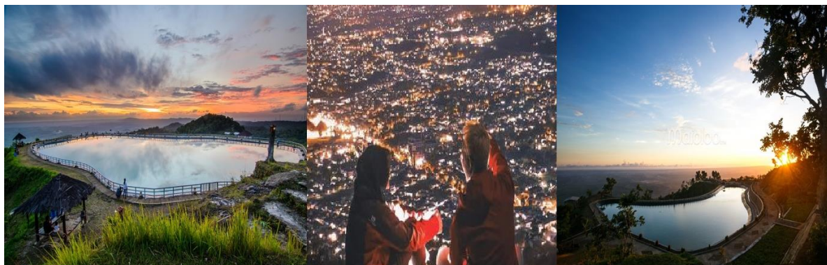
Gambar 1: Instagram Gen Z Berwisata

Bagi gen Z, tripping activity ke tempat-tempat wisata saat ini tidak hanya menjadi kebutuhan jiwa yang harus dipenuhi, namun berwisata juga merupakan media eksistensi diri mereka dalam bergaul dan bersosialisasi.