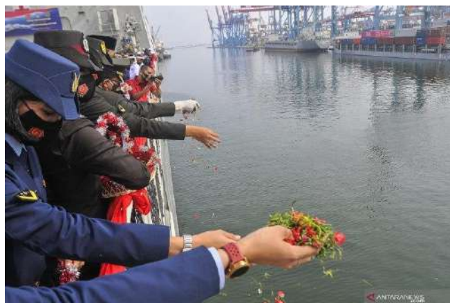
Gambar 2 : Prosesi tabur bunga di atas KRI Semarang, Tanjung Priok, Jakarta Utara