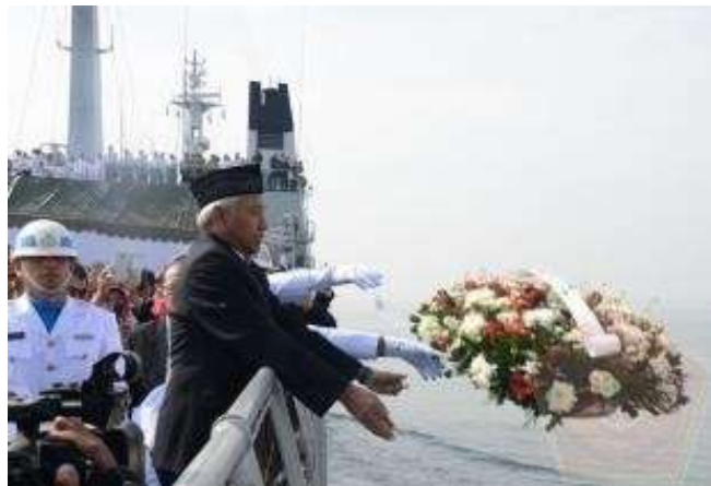
Gambar 1 : Upacara Tabur Bunga di Laut di perairan Teluk Jakarta dengan menggunakan KRI Surabaya-591